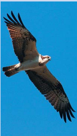
En fiskgjuse seglar.