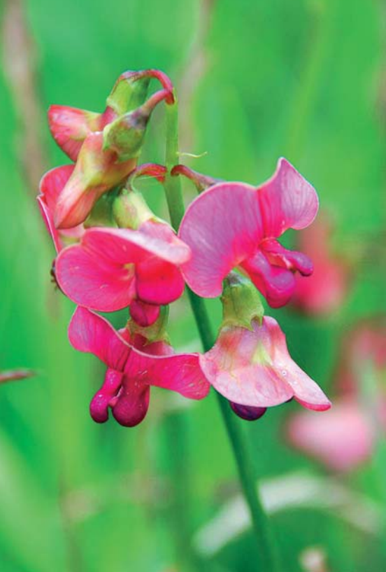
I juli-augusti blommar backvialen, som kan bli upp till 2 m och klänger sig upp på andra växter.