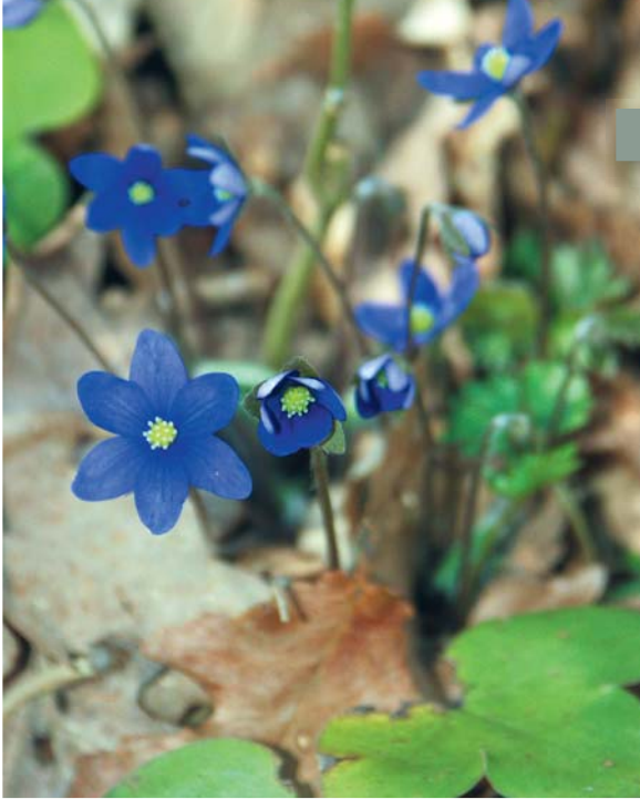
Blåsipporna blommor i Birgittakällans lövskog.