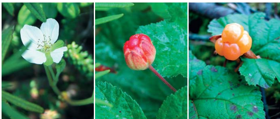
I juni blommar hjortronen. Frukterna är först röda, men som mogna är de orangegula till färgen.

På en markbädd av vitmossor växer ett risskikt av skvattram, odon, ljung och kråkbär. Skvatramdoften är så stark att man nästan blir yr i huvudet. Hjortron, myrmarkernas guld, kan börja skördas här i slutet av juli. Den som trodde att fjärilar bara befinner sig på blommande ängar kanske blir förvånad om de kommer hit en solig sommardag. Här fladdrar mängder av fjärilar i olika färger och storlekar. Här finns bland annat de tre sällsynta fjärilarna tallgräsfjäril, starrgräsfjäril och svartvingad pärlmorfjäril.