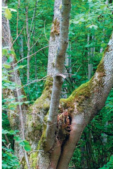
Inne i lövskogsdjungeln finns grova träd som tidigare stått öppet, som den här gamla asken med tydliga spår av hamling.

Det kvittrar sjunger och visslar i träd-kronornas gröna tak. Koltrastarna prasslar i löven på marken. Halvägs upp i en ek sitter en ekorre och tjatrar varnande och viftar lite på sin yviga svans. I den mångformiga lövskogen av alm, lind, ask, ek, hassel, björk och asp är mångfalden av insekter, fåglar, mossor, lavar och svampar mycket stor. Här finns bland annat den rödlistade kandelabersvampen och lavarna brunskaftad blekspik och almlav. Den näringsrika skogen bjuder ett dukat bord av död ved och den avlägsna lugna platsen är ett paradiset för många ovanliga arter. I en skalbaggsinventering 1989 hittade man här inte mindre än 86 arter, varav 17 indikatorarter och rödlistade arter.