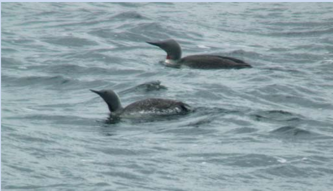
Ett par smålom.

Vassgölen (7): Från Malexander åk norrut mot "Danielshammar" ca 5 km till trevägskorset vid Solsätter. Därifrån åk i riktning mot "Hallingsfall" i ca 2,5 km. Sväng vänster in på väg och fortsätt ca 2 km tills du ser Östgötaledens orangea markeringar korsa vägen. Parkera (1 bil) på lämpligt sätt i vägkorset (P7) och promenera Östgötaleden söderut ca 1 km till Vassgölen. Från Malexander kan man också gå Östgötaleden hit ca 7 km (ca 2 km från Ärtväxtvägen). Östgötaleden går i samma sträckning som gamla kyrkstigen från Nargöl i Ulrika till kyrkan i Malexander. Se kartan sid 59.