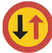
Vägs skylt - B6 Väjningsplikt mot mötande trafik

Man önskar också sätta upp en stopp skylt vid utfarten från Rödingvägen mot Malexandervägen, istället för den lämna företrädes skylt som sitter där idag, samt att det sätts upp nedanstående skyltar vid chikanerna på Söderleden, för att underlätta för trafikanterna vem som ska köra först.