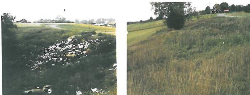
Foto 1, 2: Soptippsområde Ryckelsby; vänstra fotot: Foto från inspektion, år 1970; högra fotot: det samma området idag