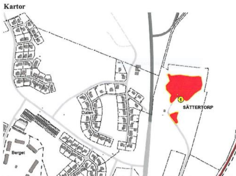
Figur: Lokalisering av de två partierna från Sättertorps avfallsupplag

MIFO1, genomförd 2012, riskklass: 3. Det föreligger en viss osäkerhet vid bedömningen av föroreningsnivå. Även om deponin tilldelats den tredje riskklassen, bör en enklare provtagning genomföras för att förbättra klassningens säkerhet.