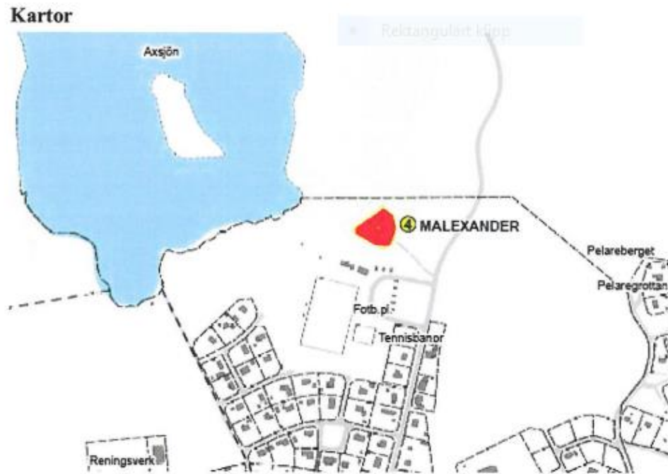
Figur: Lokalisering av avfallsupplag Malexander

MIFO1, genomförd 2012, riskklass: 3. Beläget i anslutning till område med högt skyddsvärde.