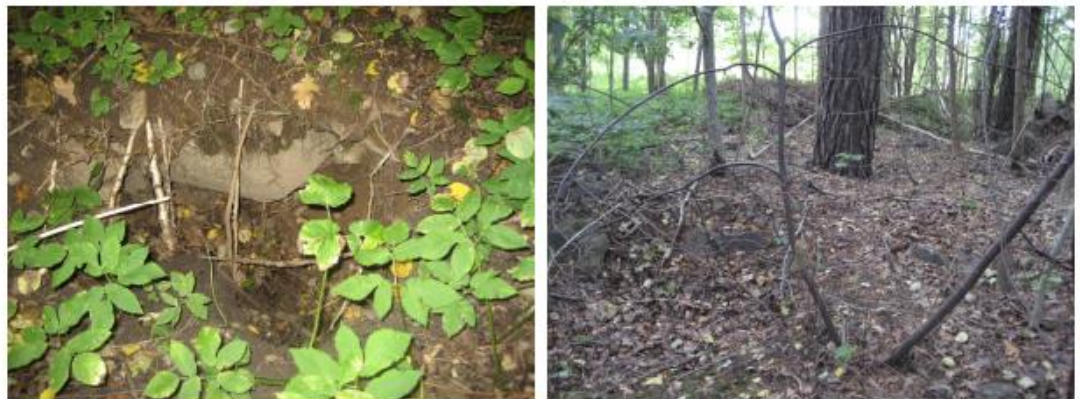
Foto 1, 2: Soptippsområde Strålsnäs; vänstra fotot: håligheter i mark; högra fotot: centralt område med stenar på västra sidans utkant