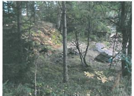
Foto 1, 2: Sottippsområde Malexander; vänstra fotot: soptippsområde med mellanlager för trädgårdsavfall; högra fotot: kanten av det gamla grustaget med den skymtande träboden.