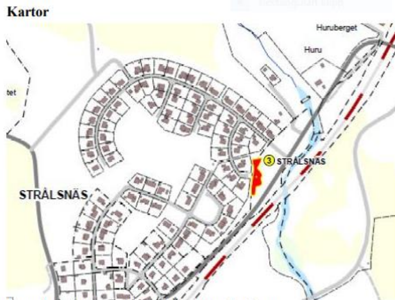
Figur 1: Lokalisering av avfallsupplag Strålsnäs

MIFO1, genomförd 2012, riskklass: 3. Närheten till bostäder och till Lillån gör att deponin placeras i riskklass 3. Det föreligger en viss osäkerhet vid bedömningen av föroreningsnivå. Även om deponin tilldelades den tredje riskklassen, bör en enklare provtagning genomföras för att förbättra klassningens säkerhet.