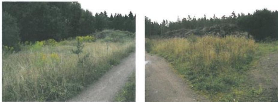
Foto 1, 2: Soptippsområde Sättertorp; vänstra fotot: Foto från deponins mindre parti; högra fotot: Större parti med ris mellanlager.